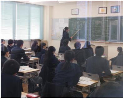
冬季課外授業の様子

志望校もかなり悩みながら提出しました。今の学力ではかなり難しい目標だと思いましたが、将来を見据えて「コソコソと努力してほしい」と思っています。部活の練習により学習時間はどうしても短くなります。先生方がお話されるように授業を大切にして学力を身につけてほしいと思います。