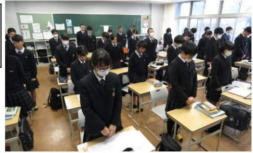
1月17日 学校交通安全日 今回は、阪神淡路大震災の犠牲者に対しても黙祷

「情報技術を癌の早期発見や新薬の開発に活用する！」— 一見無関係に見えるこのミッションに挑み、光や電波を使った最先端技術を駆使して、人の役に立つ計測システムや情報システムを開発しています。私が研究を進めている「光ピンセット」は、発明したアーサー・アシュキン博士が、2018年のノーベル物理学賞を受賞したことを機に、注目が高まっています。光の放射圧を利用し、顕微鏡で見るような数ミクロンの粒子をレーザー光で捕まえて、自由に動かすことのできる技術で、微力な力や細胞の硬さを計測することができます。これにより、がん細胞の詳しい特性判別や、抗がん剤の効き方評価の分野で、実用化が期待されています。情報技術の立場で物理の最先端を研究することで、コンピューター制御などを取り入れることができ、数ミクロン単位の細胞も簡単に扱うことができるようになります。がんの早期発見や、新薬の開発などにも繋がるこの研究を、これからも続けていきます。