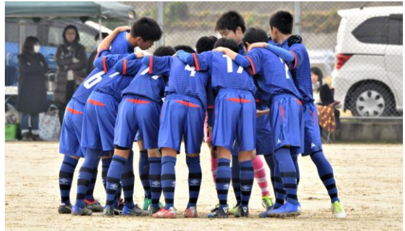
サッカー部試合中の情景