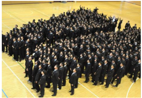
3年生卒業アルバム集合写真撮影