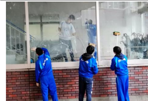
理工科3年有志 ボランティア清掃活動

高校3年の後期。第一子のため、全てが初めてだった我が家。あつという間の三年間でした。先生方に感謝です。卒業までの残りの日々を大切に過ごしてほしいと思います。