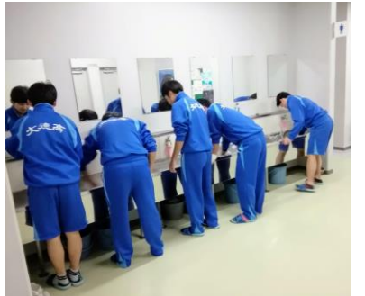
理工科3年有志 ボランティア清掃活動

「人生の岐路に立っている君へを拝見しました。2年は文理選択により目標(学)を共にする仲間と学園生活を充実させている様に見取れます。しかし、専門分野の学習が高度となり悩む様子もありません。当たり前の事は皆やっているのです。それ以上の努力がこれからは益々必要になってくると思えます。