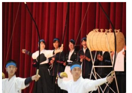
部活動紹介 弓道部

一年間があつたという間に過ぎ、二年生になりました。中学生の頃よりずいぶんたくましくなり、勉強部活と充実した日々を送っています。新学期、忙しくなりますが、新たな気持ちで親子