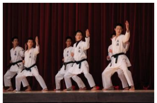
部活動紹介 空手道部