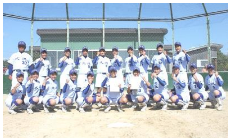
女子ソフトボール部 選抜大会熊本予選優勝 全国選抜大会へ駒を進める

現在私は、歩行弱者のための移動支援、インターネットを使用し管理するスマート雨水タンクを用いた水災害に関する防災、のら猫の不妊手術活動を支援するサービス「ねこでる」など、社会に存在する解決の難しい問題に情報工学の知識と技術を活かして取り組んでいます。何か1つのことを研究していると言うよりは、他の分野の研究者や組織、地域のコミュニティと連携して様々な活動をしています。「プログラミング」や「ソフトウェア開発」が大好きですので、コンピュータ上で動くシステムやサービスを提案、設計、開発することを得意としています。異分野の研究者が素晴らしいアイデアを持っていても、国内では分野をまたいだ連携が海外と比べて少ないため情報技術に優れた人が周りに居ないことで研究がなかなか進まない状況です。そうならないように、得意分野を共有して研究を前進させ社会に価値を提供することを、研究スタイルにしています。学生にも、不得意なことに悩むよりも、得意分野を存分に伸ばして楽しんで欲しいと願っています。