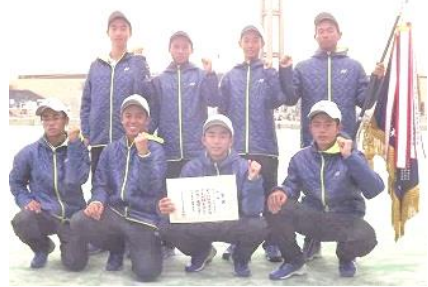
ソフトテニス男子 全国選抜予選 学校対抗ソフトテニス大会 団体優勝

不安を行動の原動力に ～進路指導部(進学編)～ センター試験まで二カ月を切りました。本番を目前に控えた3年生諸君は、不安や焦りと常に隣り合わせだと思えます。大舞台を前にして、人は誰も不安を感じるものです。頭痛に効く鎮痛剤のように、不安に効く「特効薬」があればよいのですが、残念ながらそんな魔法のアイテムは存在しません。不安を払拭するためには、「日々の積み重ね」しかないのです。だからと言って、ただ力任せに取り組むことはあまりお勧めしません。それは、日によって気分がムラがあつたり、無理をし過ぎて体調を悪くしたりする恐れもあるからです。残された時間を最大限に活用するためにも、自分の