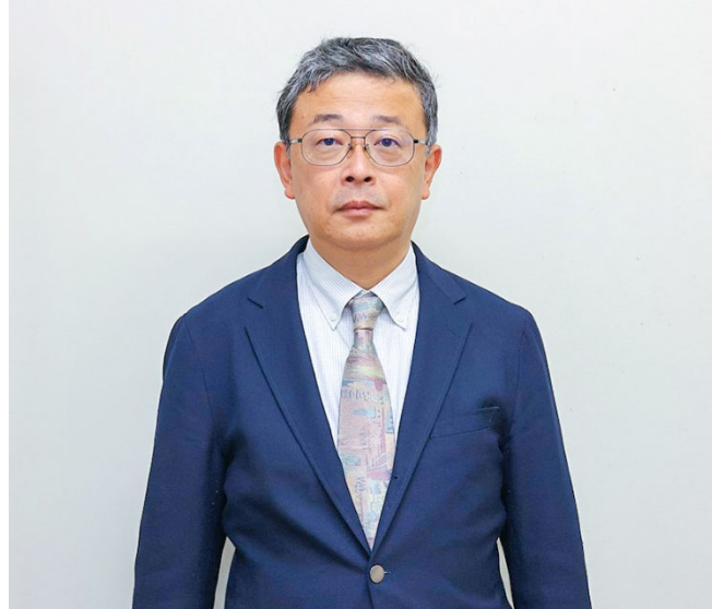
生物生命学部 生物生命学科