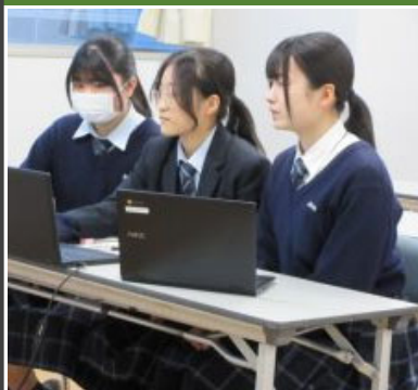
リモートで発表している様子

発表後の講評では、「プレゼンテーションが分かりやすくまとまっていて上手であった。中身について着目点が良い。どういう業種が生きて、どういう業種でシャッターが閉まってしまったのか調査するといったのでは。熊本はファッションに関する感覚が高いので、シャワー通りのテナントを借りて、スワップマーケットを行う企画など、クラウドファンディングを活用したらどうか。」等のアドバイスをいただきました。