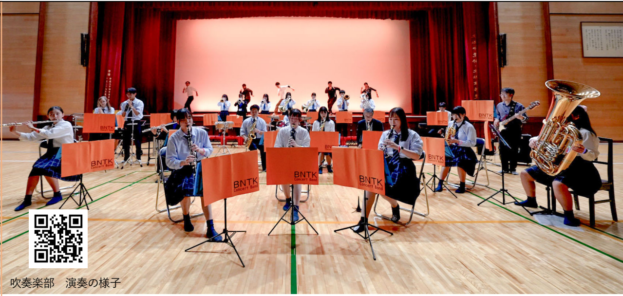
吹奏楽部 演奏の様子