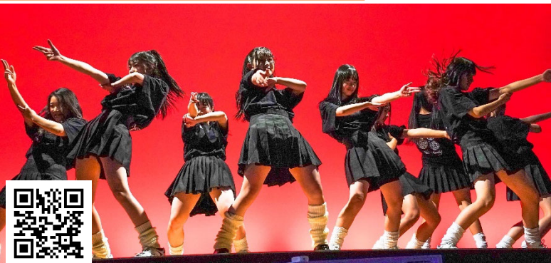
ダンス同好会の発表

熊本市西区池田4-22-2 文徳高等学校広報部発行 TEL096-354-6416 FAX096-359-2373